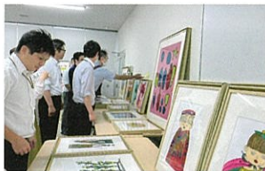
ならコープの職員とアート作品の「お見合い」の風景