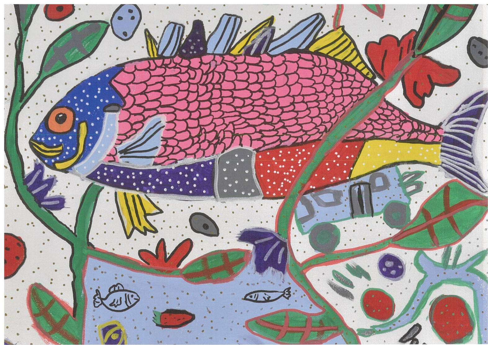
「さかなが、さいたので、いろいろです。」 風香